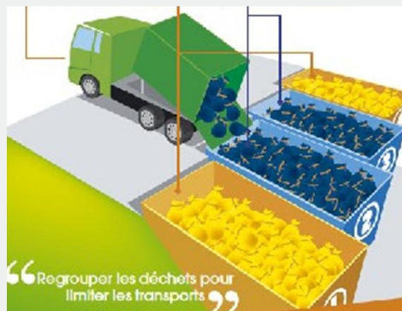
Illustration extraite du site Internet du SMTD