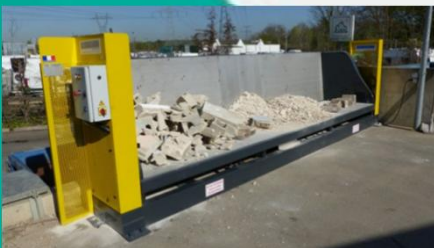
Ex : déchèterie à plat