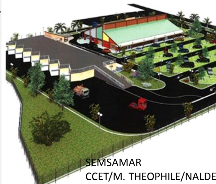
SEMSAMAR CCET/M. THEOPHILE/NALDEC