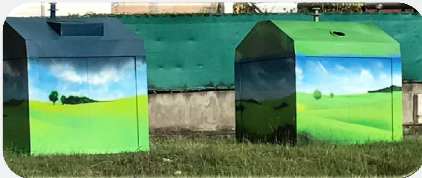
PAV de la CANGT en cours d'embellissement